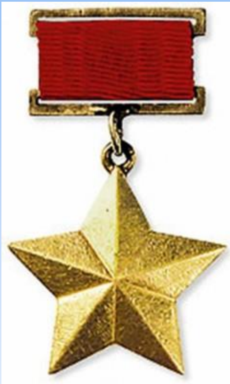
Медаль города -Героя